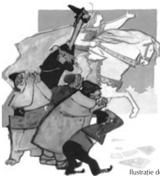
Ilustrație de Roni Noel

• Oralitatea devine, în acest context, componenta stilistică fundamentală a prozei lui Creangă. „Acestui scop suprem îi sunt subsumate cele mai multe dintre procedeele artei sale. Comunicarea cititorului cu marele humuleștean beneficiază, prin aceasta, de un spor de autenticitate, în stare să creeze iluzia unui colocviu intim, dincolo de vreme.” (Gh. I. Tohăneanu)