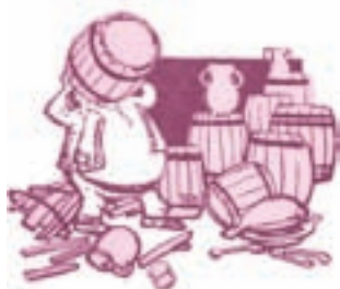
Ilustrație de Roni Noel

Personajul antagonist este construit prin antiteză față de personajul principal sau față de alte personaje.