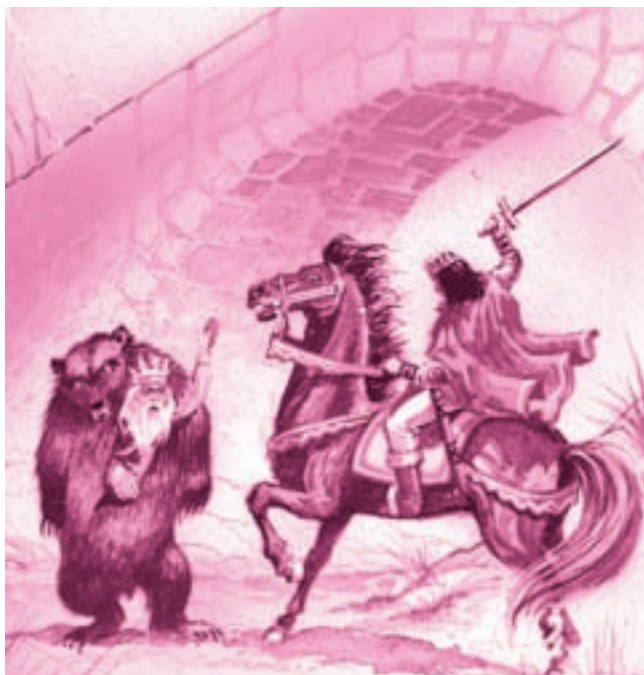
Ilustrație de Walter Riess

Argumentați, cu elemente din text, natura reală sau fantastică a spațiului în care se petrece acțiunea din fiecare secvență.